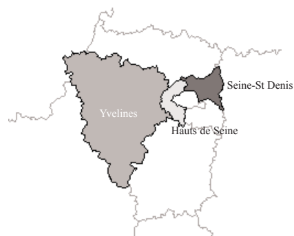
Carte 2 Ile-de-France