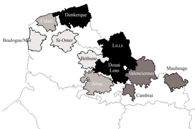
Carte 1 Nord-Pas de Calais