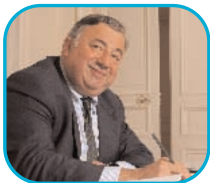
Gérard LARCHER Ministre délégué à l'emploi, au travail et à l'insertion professionnelle des jeunes

A ujourd'hui nombre d'entreprises connaissent des difficultés de recrutement, en particulier dans les secteurs comme la santé, les services à la personne, mais aussi l'industrie et le bâtiment. Dans le même temps, le taux de chômage des jeunes reste encore beaucoup trop élevé.