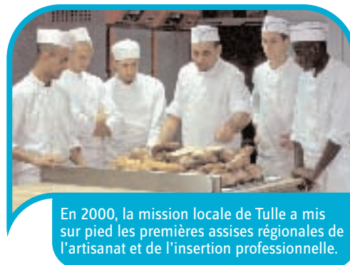
En 2000, la mission locale de Tulle a mis sur pied les premières assises régionales de l'artisanat et de l'insertion professionnelle.