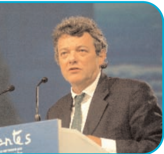
Jean-Louis BORLOO Ministre de l'emploi, de la cohésion sociale et du logement